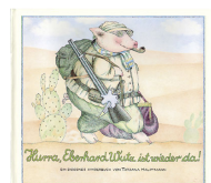
Hurray for Petronella Pig 32 pages 1979