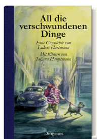
All the Missing Things 96 pages 2011