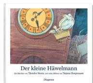
Little John 40 pages 2011