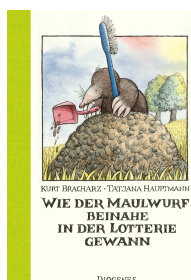
How the Mole Nearly Won the Lottery 64 pages 1981