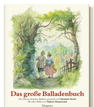
The Great Book of Ballads 152 pages 2009