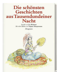
The Most Beautiful Tales From the Arabian Nights 144 pages 2008