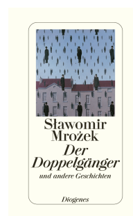
The Doppelgänger 272 pages 2000