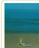
Slawomir Mrozek Der Botschafter und andere Stücke Diogenes