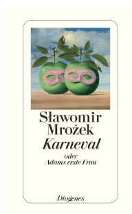
Carnival or The First Wife of Adam 80 pages 2014