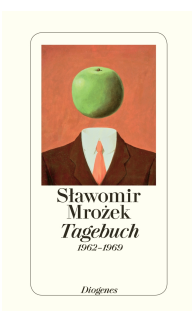
Journal 1962 - 1969 544 pages 2014

Slawomir Mrozek was born in Borzecin, Poland, in 1930. He was first known as a caricaturist and author of satirical short stories. His plays ( Tango , The Emigrants , Striptease , and many others) made him world famous. In 1968 he went into exile. After living many years in Paris and later in Mexico, he returned to Poland in 1996 and spent the final years of his life in southern France. He died on August 15, 2013 in Nice.