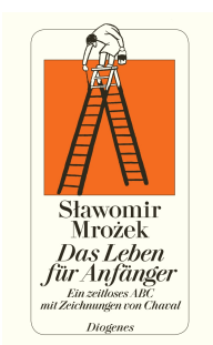
Life for Beginners 192 pages 2004