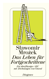
Life for the Advanced 240 pages 2006