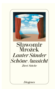
All Sinners and A Lovely View 208 pages 2002