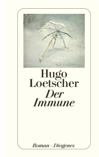
The Immune Man 448 pages 1985