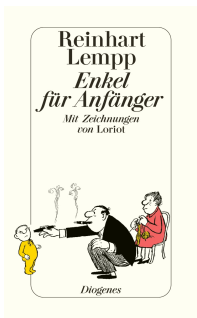
Grandchildren for Beginners 72 pages 1989