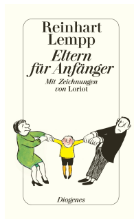
Parents for Beginners 64 pages 1973