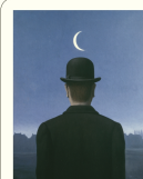
Slawomir Mrozek Tango Schauspiel in drei Akten Diogenes