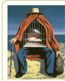
Slawomir Mrozek Mein unbekannter Freund und andere Geschichten Diogenes