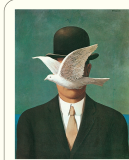
Slawomir Mrozek Watzlaff und andere Stücke Diogenes