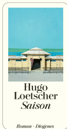
Season 416 pages 1995