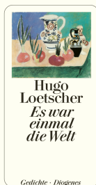
Once There Was the World 128 pages 2004