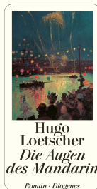
The Eyes of the Mandarin 384 pages 1999