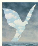
Slawomir Mrozek Auf hoher See Zwei Einakter Diogenes