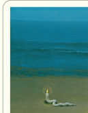
Slawomir Mrozek Der Botschafter und andere Stücke Diogenes