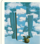
Slawomir Mrozek Liebe auf der Krim Eine tragische Komödie in drei Akten Diogenes