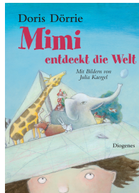
Mimi Discovers the World 32 pages, 20.8 x 29 cm 2006