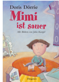
Mimi gets Mad 32 pages, 20.8 x 29 cm 2004