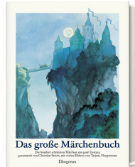
The Giant Book of Fairy Tales 672 pages, 22 x 27 cm 1987