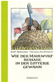
How the Mole Nearly Won the Lottery 64 pages, 15.5 x 19 cm 1981