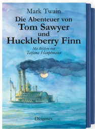
The Adventures of Tom Sawyer and Huckleberry Finn 816 pages, 14.3 x 21.3 cm 2002