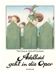
Adelheid Goes to the Opera 32 pages, 22.5 x 28.5 cm 1980