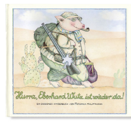
Hurray for Peregrine Pig 32 pages, 31.8 x 28.5 cm 1979