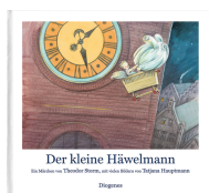
Little John 40 pages, 27.5 x 25.2 cm 2011