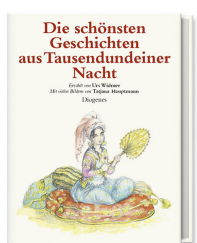
The Most Beautiful Tales From the Arabian Nights 144 pages, 22 x 27 cm 2008