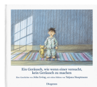
A Sound like Someone Trying Not to Make a Sound 40 pages, 27.5 x 25.2 cm 2003