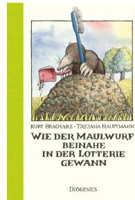
How the Mole Nearly Won the Lottery 64 pages, 15.5 x 19 cm 1981