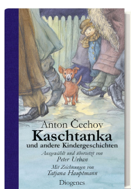
Kashtanka 160 pages, 14.3 x 21.3 cm 2004