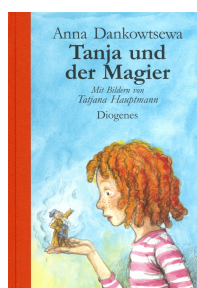
Tanja and the Magician 192 pages, 14.3 x 21.3 cm 2004