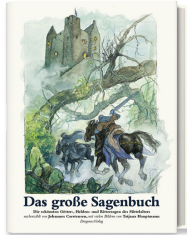
The Great Book of Legends 240 pages, 22 x 27 cm 1997