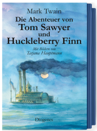
The Adventures of Tom Sawyer and Huckleberry Finn 816 pages, 14.3 x 21.3 cm 2002