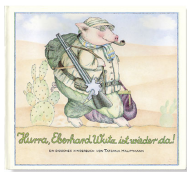
Hurray for Peregrine Pig 32 pages, 31.8 x 28.5 cm 1979