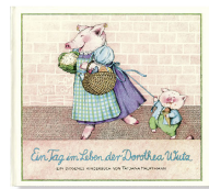
A Day in the Life of Petronella Pig 32 pages, 31.8 x 28.5 cm 1978