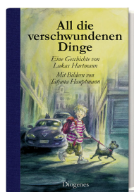
All the Missing Things 96 pages, 14.3 x 21.3 cm 2011