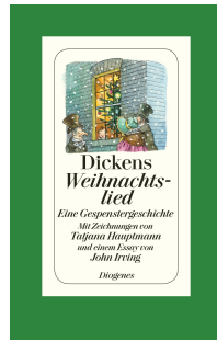
A Christmas Carol 160 pages 1982