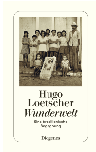
Was My Time My Time 192 pages 1983