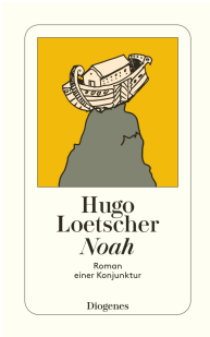
Noah 144 pages 1984