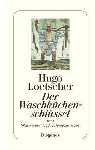
The Laundry Room Key 192 pages 1988 Movie Adaptation