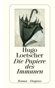
Papers of the Immune Man 512 pages 1986