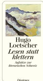
Read, Don't Climb! 448 pages 2003