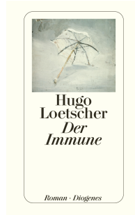
The Immune Man 448 pages 1985