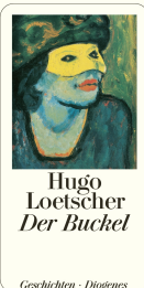
The Hunchback 224 pages 2002