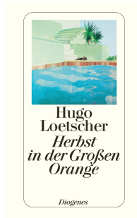
Autumn in the Big Orange 168 pages 1982