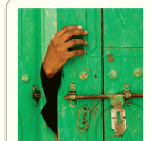
Petros Markaris Die Kinderfrau Ein Fall für Kostas Charitos Roman · Diogenes

Bad Credit 400 pages 2011 🏆 Award winner 🏆 Bestseller