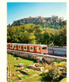
Petros Markaris Quer durch Athen von Petros Markaris Diogenes