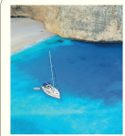
Petros Markaris Offshore Ein Fall für Kostas Charitos Roman · Diogenes