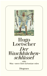
The Laundry Room Key 192 pages 1988 🎬 Movie Adaptation