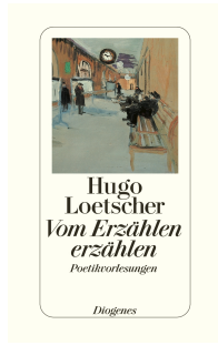
Telling about Story-Telling 176 pages 1988