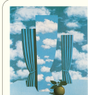
Slawomir Mrozek Liebe auf der Krim Eine tragische Komödie in drei Akten Diogenes