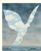
Slawomir Mrozek Auf hoher See Zwei Einakter Diogenes