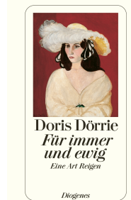
For Ever and Always 304 pages 1991