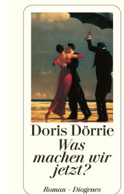
Where Do We Go from Here? 304 pages 1999