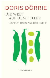
The World on a Plate 208 pages 2020