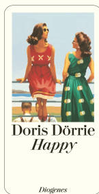
Happy 112 pages 2001