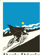
Doris Dörrie »Was wollen Sie von mir?« Erzählungen · Diogenes

»What Do You Want From Me?« 192 pages 1989