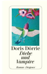
Thieves and Vampires 224 pages 2015