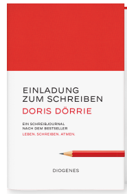
Invitation to Write 224 pages 2021