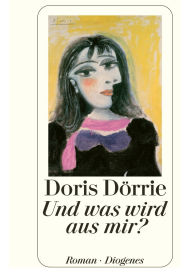
And What About Me? 432 pages 2007