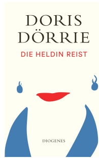
The Heroine's Journey 240 pages 2022