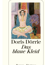
The Blue Dress 192 pages 2002