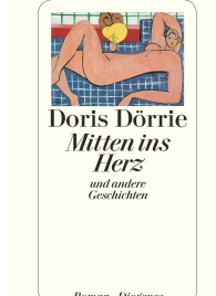
Straight to the Heart and Other Stories 432 pages 2004