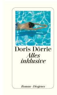
All Inclusive 256 pages 2011