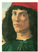
Doris Dörrie Der Mann meiner Träume Diogenes