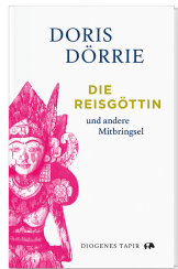
The Rice Goddess 112 pages 2024