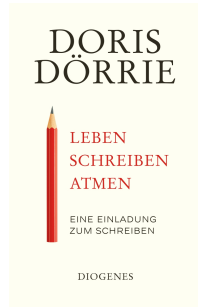
Living, Writing, Breathing 288 pages 2019