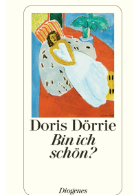
Am I Beautiful? 352 pages 1994