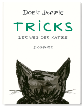
Tricks 48 pages 2026