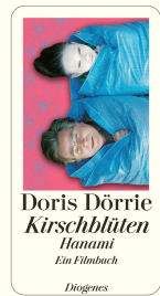
Cherry Blossoms - Hanami 216 pages 2008