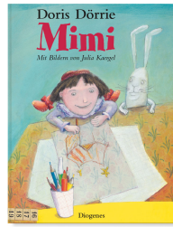
Mimi 32 pages, 20.8 x 29 cm 2002