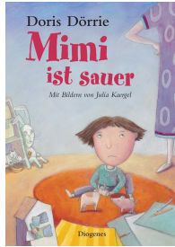
Mimi gets Mad 32 pages, 20.8 x 29 cm 2004