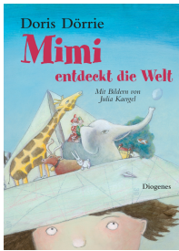
Mimi Discovers the World 32 pages, 20.8 x 29 cm 2006